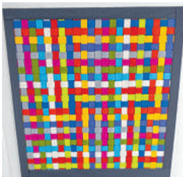
Für den Wandbehang aus Wollfilz bestellte die Künstlerin noch Material.

Sie hofft an diesem Tag nicht nur auf viele Kunstinteressierte, sondern auch auf Menschen, die sich für ganz besondere Spiele begeistern können und für einen guten Zweck spenden möchten. Aus traurigem Anlass: „Mein Vater ist vor vier Wochen im Alter von 89 Jahren verstorben. Er war eigentlich Kaufmann, hat aber mit großer Begeisterung Quiz- und Geschicklichkeitsspiele entworfen, darunter den bekannten Magicus-Würfel, eine Art Geduldsspiel aus Plexiglas mit einer Metallkugel. Jetzt möchte ich die zahlreichen Spiele aus seinem Nachlass verschenken“, sagt die Künstlerin, die aus den Spiele-