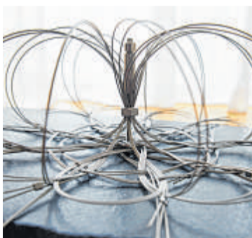
Wie Insekten wirken die Objekte aus Edelstahl-Seilen.

„Für mich ist es eine Art Trauerbewältigung, die Spiele meines Vaters wegzugeben und damit etwas Gutes zu bewirken“, sagt Konstanze Ziemke-Jerrentrup. Sie könne sich vorstellen, dass die Quizspiele auch bei Firmen als Kundenge-